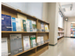
情報調査室の様子